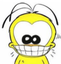
de la bonne humeur