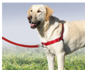
harnais attache frontale