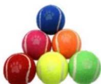
Des balles et jouets