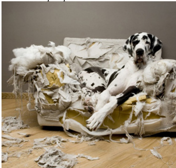
Mieux vaut éviter d'en arriver là...

Le meilleur ami de l'homme est un animal qui aime vivre avec son humain. Il est donc très difficile pour lui de rester seul à la maison mais vu que nous devons travailler pour le nourrir nous n'avons malheureusement pas forcément le choix. Ayant peur d'être abandonné, il peut pleurer, détruire, s'auto mutiler pendant votre absence. Il faut donc qu'il comprenne que vous partez mais que vous allez revenir. Pour ce faire, il faut commencer par des départs de quelques secondes. Vous demandez à votre chien de rester là et vous lui dites que vous allez revenir. Vous ouvrez la porte, sortez et rentrez immédiatement en récompensant votre chien d'être resté sage 2 secondes. Puis vous recommencez l'exercice en augmentant petit à petit la durée et en vous éloignant de plus en plus de la porte d'entrée. Si vous entendez votre chien pleurer c'est que vous avez été trop vite, il vous faut donc revenir un peu en arrière au niveau de la durée et de la distance. Ainsi, votre chien va comprendre que lorsque vous lui dites par exemple « Sois sage, je reviens » qu'il peut aller dormir sur ses deux oreilles car vous serez bientôt de retour et ce quel que soit l'endroit où vous le laissez.