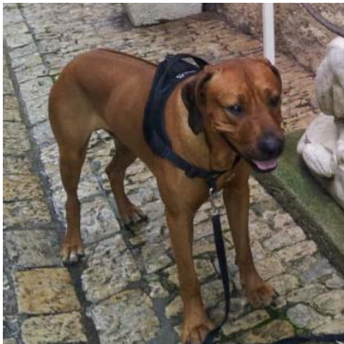
Multi Harnais Animalin avec attache frontale

tensions sur la trachée qui peuvent être dramatique) soit un harnais classique ou, pour vous aider, un harnais de marche comme par exemple le multi harnais Animalin avec l'attache frontale. N'essayez pas d'apprendre à un chien de ne pas tirer avec une laisse de type enrouleur car pour avancer, le chien doit tirer ce qui lui permet d'avoir plus d'allonge. Cela n'a donc pas de sens de lui demander de ne pas tirer avec ce genre de laisse, évitez-les donc. Choisissez plutôt une laisse d'au moins deux mètres. Une laisse courte se tend très rapidement ce qui complique extrêmement le travail.