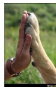
de la complicité

Montage réalisé par Amélie Manera, merci à elle.